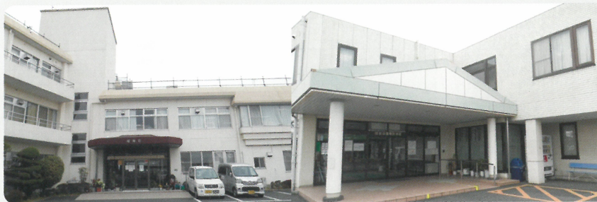
▲ 特別養護老人ホーム福寿荘