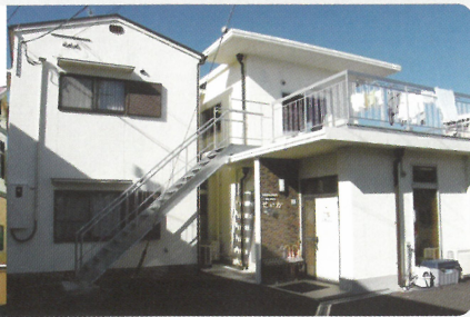
▲ グループホームせいか