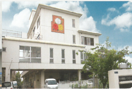
▲ 介護老人保健施設レーク・ホロニー