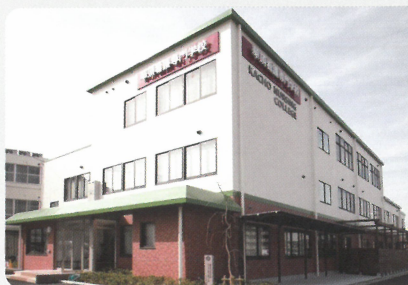
▲ 華頂看護専門学校