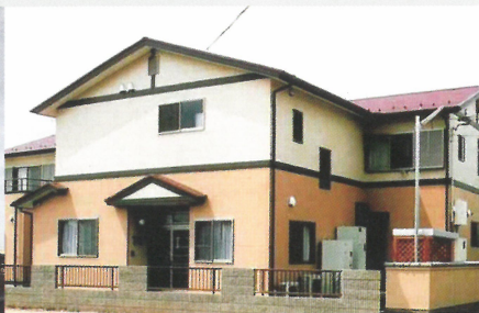
▲ グループホームはるか